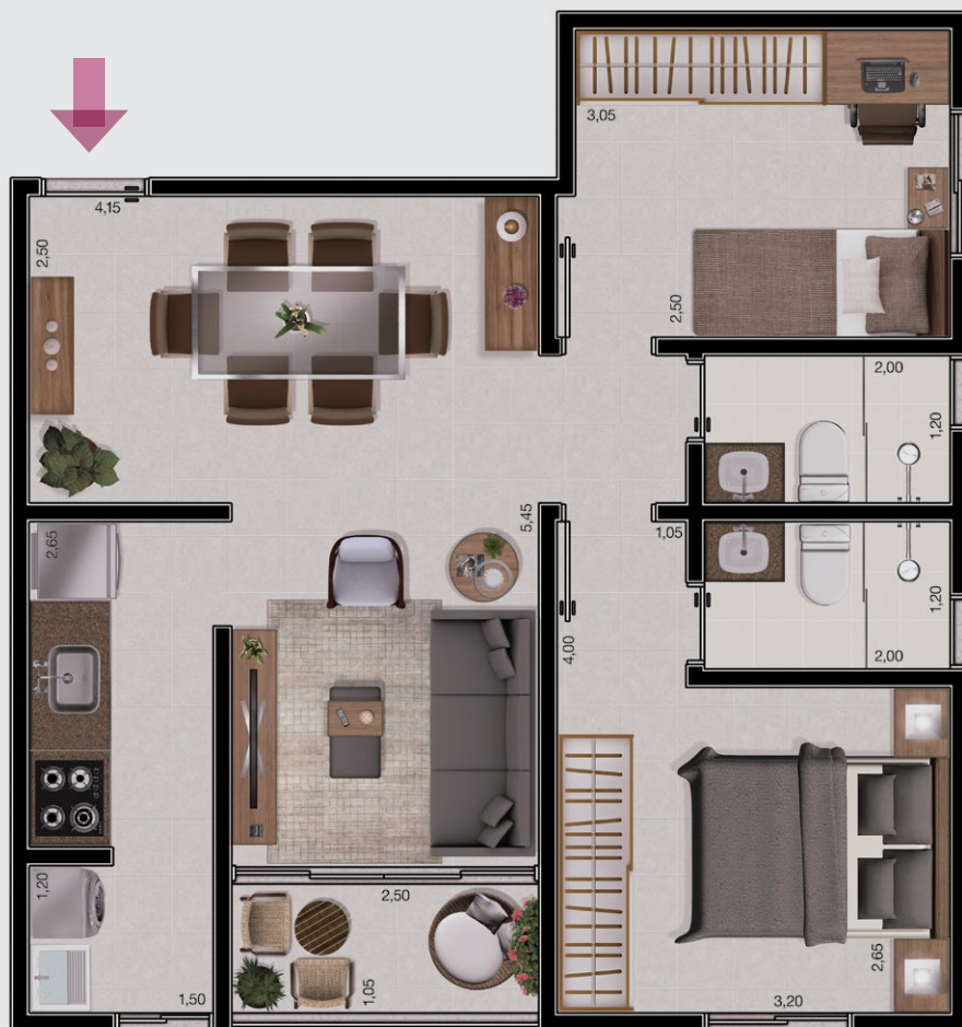
ilustração artística da planta tipo 58,20m 2 . decoração meramente ilustrativa. o empreendimento será entregue conforme memorial descritivo.