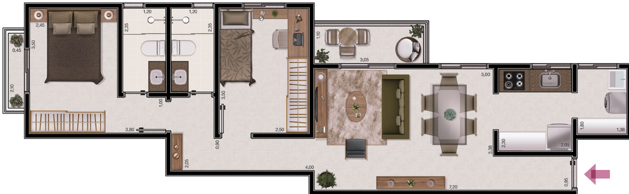
ilustração artística da planta tipo 70,80m 2 . decoração meramente ilustrativa. o empreendimento será entregue conforme memorial descritivo.