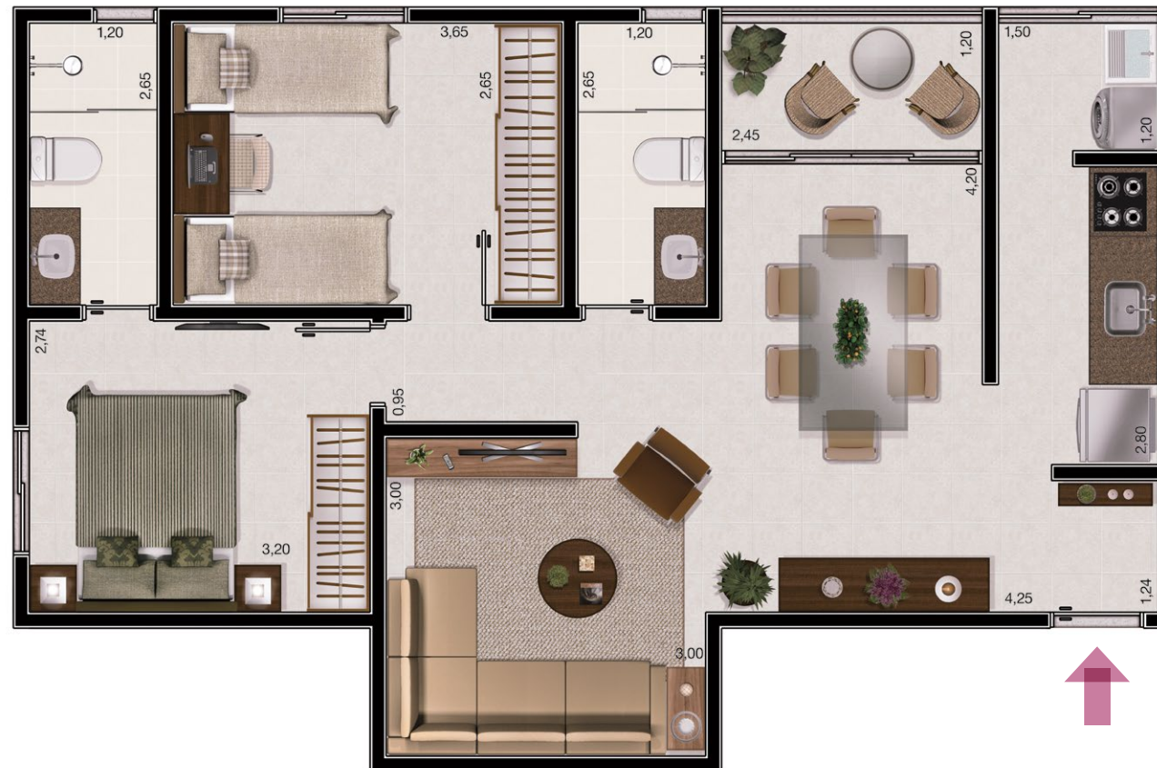
ilustração artística da planta tipo 67,52m². decoração meramente ilustrativa. o empreendimento será entregue conforme memorial descritivo.