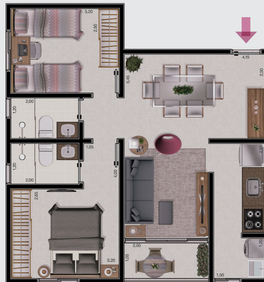
ilustração artística da planta tipo 57,80m². decoração meramente ilustrativa. o empreendimento será entregue conforme memorial descritivo.